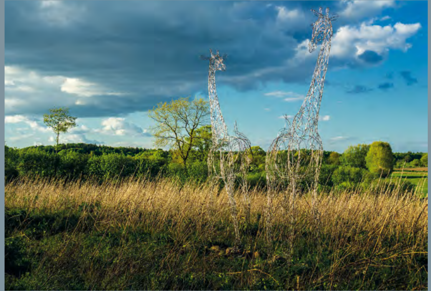
Gleb Dusavitskiy Unity