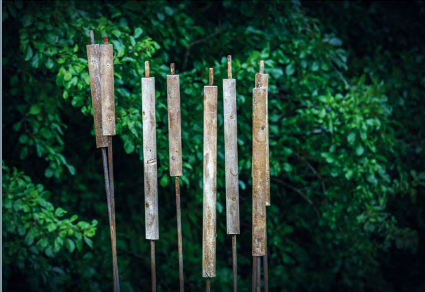
Clemens Hunger Naturinsel