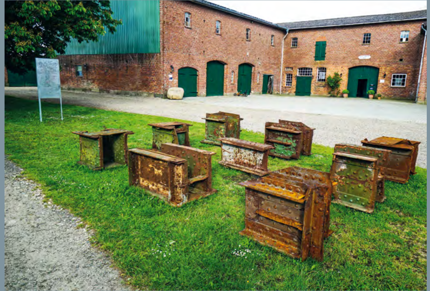
Kurt Lange Stahl spricht viele Sprachen

https://www.ndr.de/fernsehen/sendungen/schleswig-holstein_magazin/zeitreise/Zeitreise-Wie-der-Kuhschaedel-zum-Kult-Logo-wurde,zeitreise2290.html