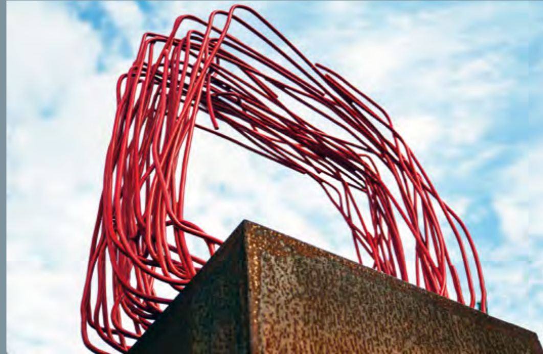
Ernst Petras Nix cube 18-3-16 Nix cube 18-6-3