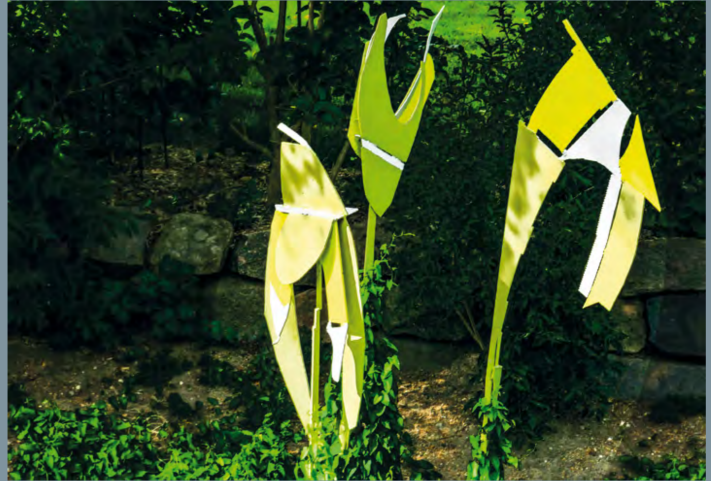
Christiane Lüdtkke Große Blumen dreiteilig