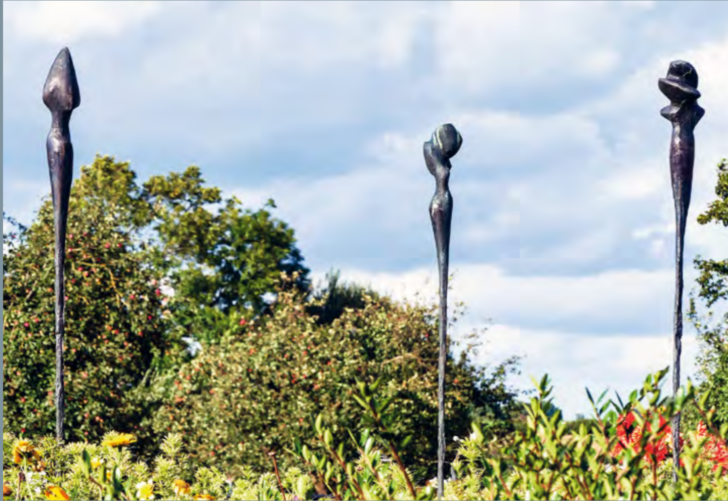
Clemens Hunger Metamorphosen 1-3