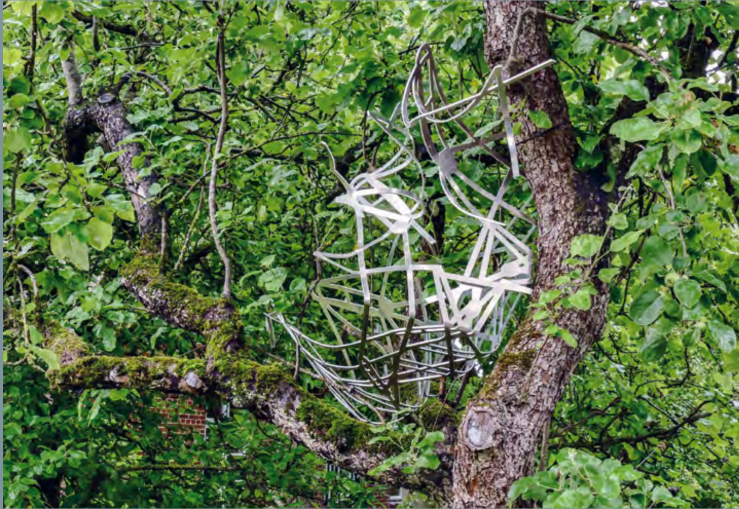
Gertraud Hasselbach Tcode