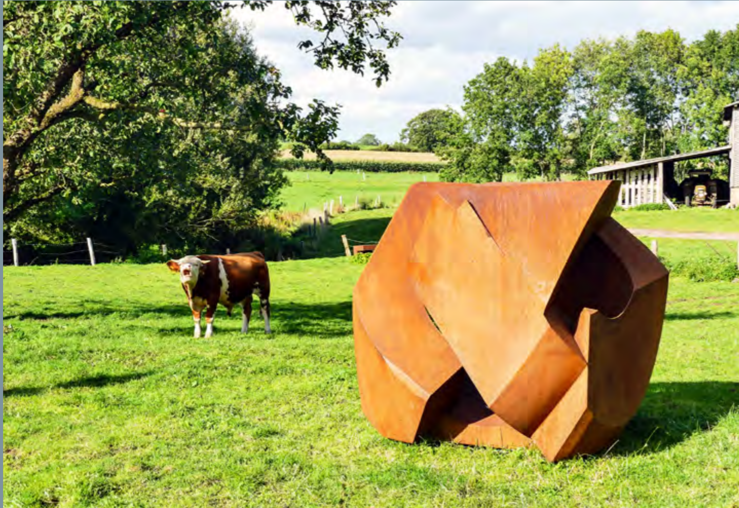
Jörg Plickat Interlocked Cube