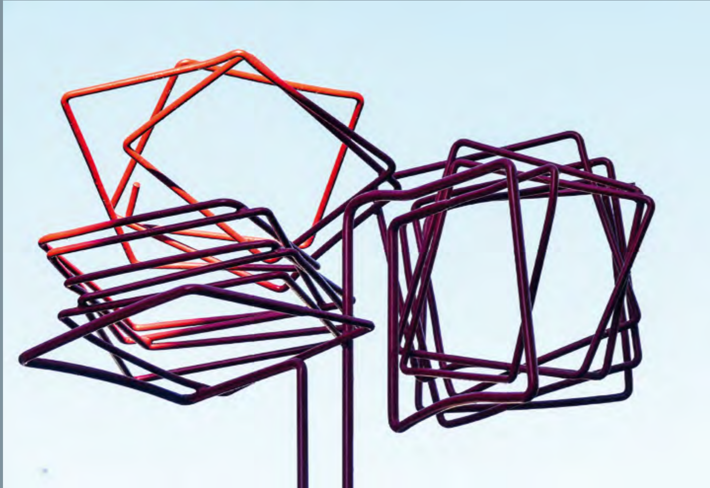
Ernst Petras Nix cube 18-2-25