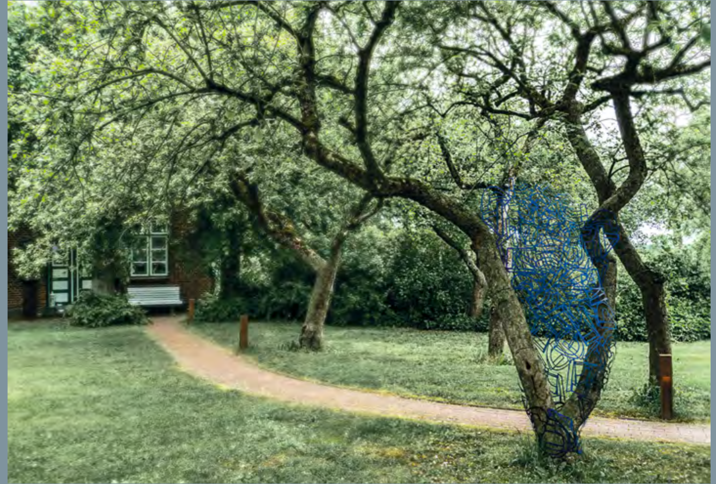
Gertraud Hasselbach SAGSCATB