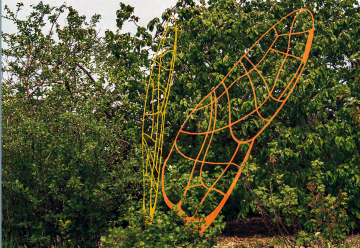
Søren Schaarup Nymphe 1 Nymphe 2