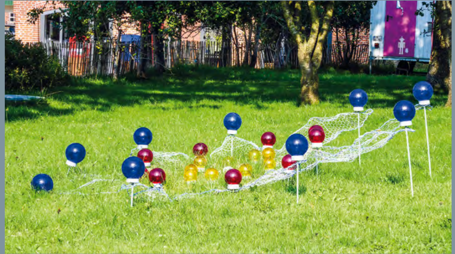
Inga Momsen Flora Metallica